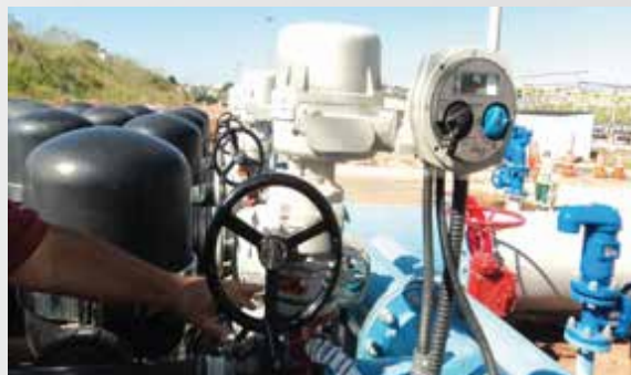
SABESP - ETE ABC - SÃO PAULO/SP