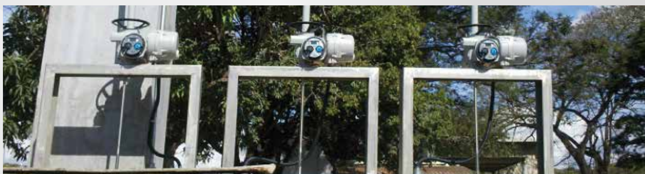
ETE SOBRADINHO - BRASÍLIA/DF