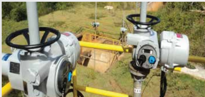
COPASA - BELO HORIZONTE