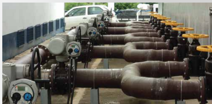
FOZ DO BRASIL - LIMEIRA/SP