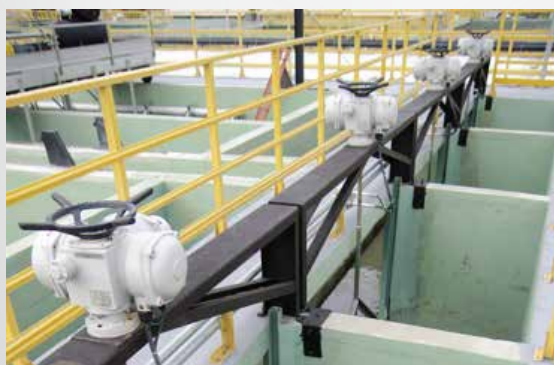
ETE SERRARIA - PORTO ALEGRE/RS