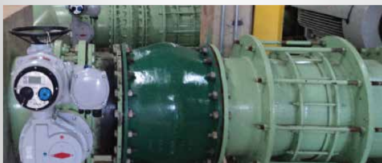
CAESB - BRASÍLIA/DF