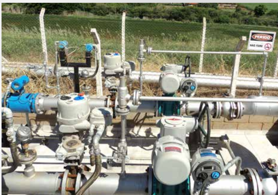
ATUADOR PARA VÁLVULA MACHO