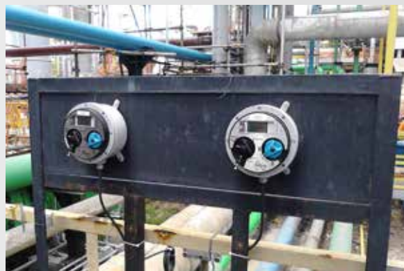
PAINEL REMOTO (EX)