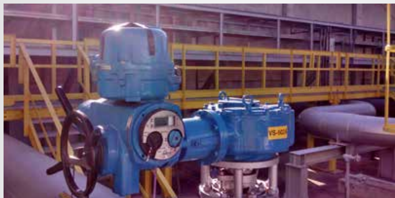
ATUADOR PARA VÁLVULA DE SUÇÃO ESFERA