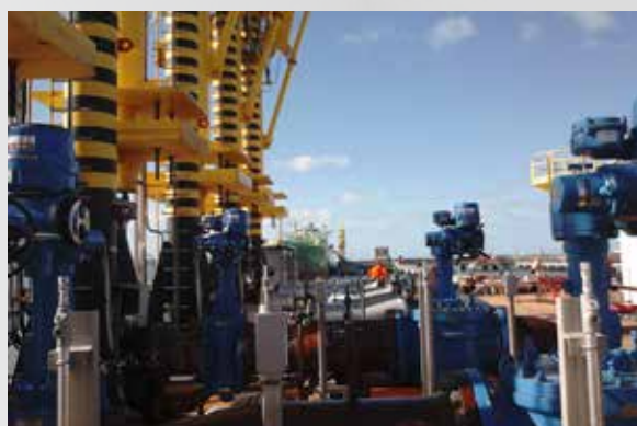
ATUADOR PARA VÁLVULA MACHO E TWIN SEAL