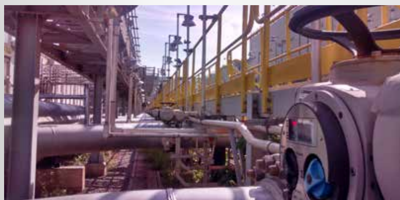
ATUADOR PARA VÁLVULA BORBOLETA