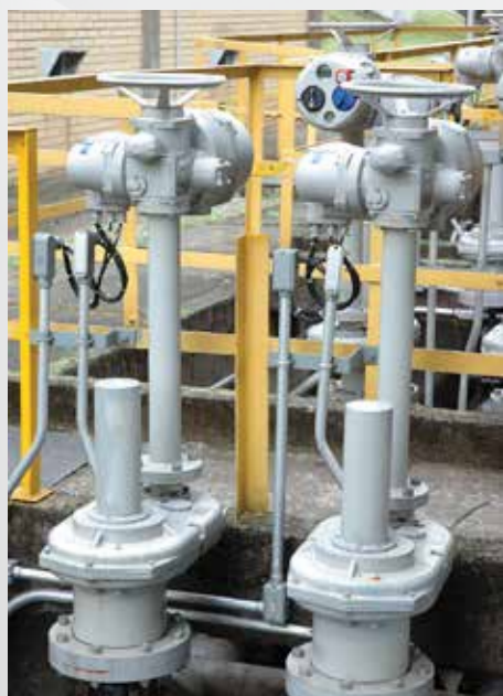
ATUADOR PARA VÁLVULA GAVETA